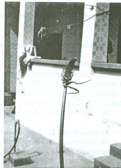
1–2. Virágzó tengeri hagyma, nyárra az udvarra kitéve (NZs, Gara 1973), virágzata kinagyítva