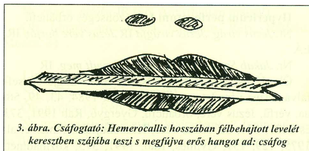
3. ábra. Csáfogató: Hemerocallis hosszában félbehajtott levelét keresztben szájába teszi s megfújva erős hangot ad: csáfog

Nr. derékfájásra, furdónek: ettől gyógyult meg a derekam, nem bírtam a derekammal... IR